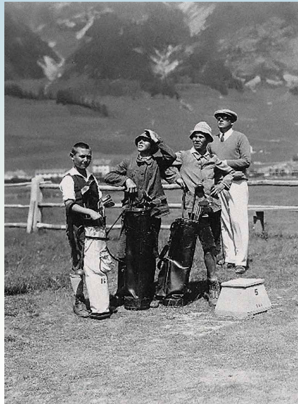
Einheimische Mädchen und Buben ergatterten die begehrten Nebenjobs als Caddie.