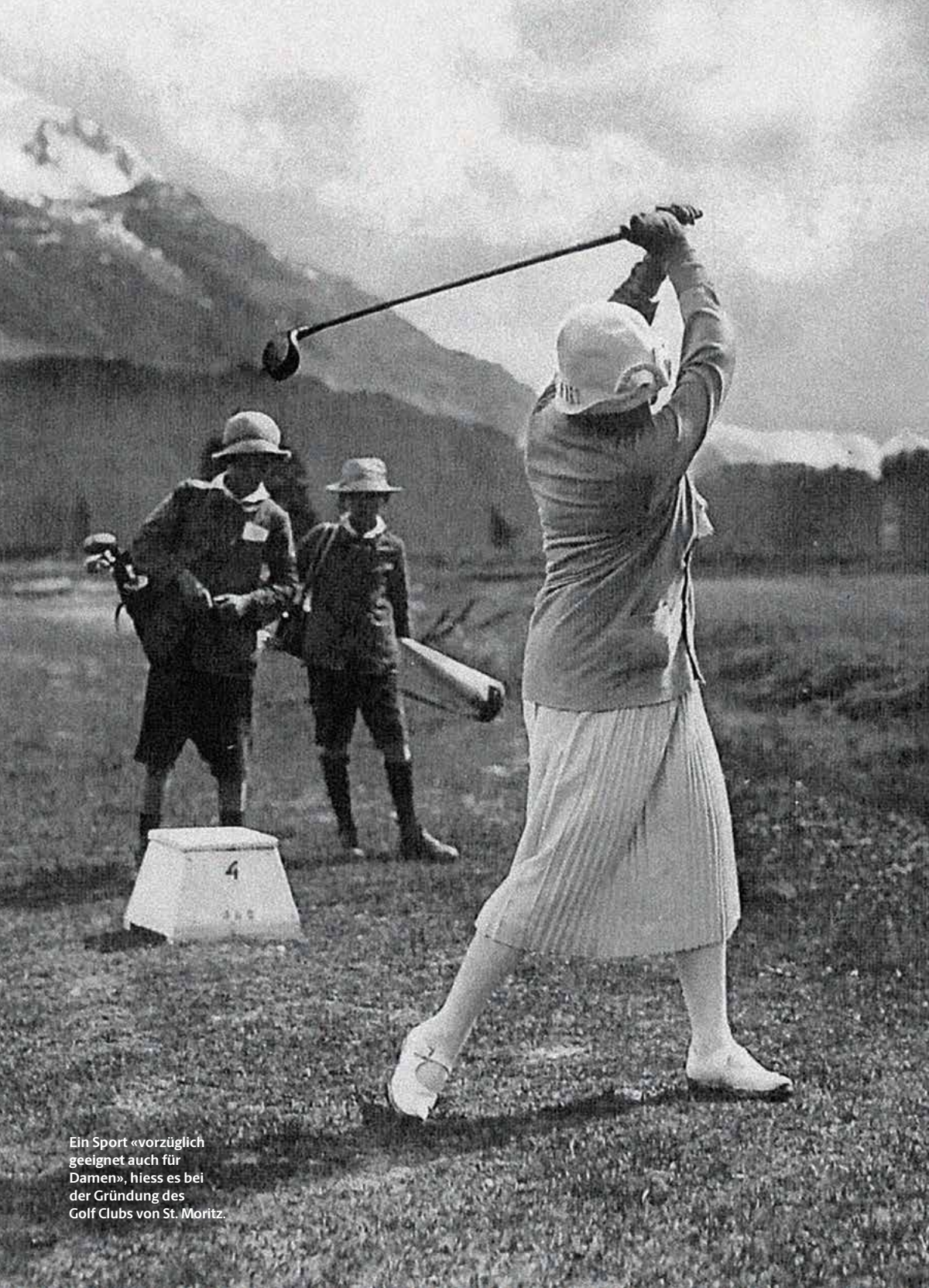
Ein Sport «vorzüglich geeignet auch für Damen», hiess es bei der Gründung des Golf Clubs von St. Moritz.